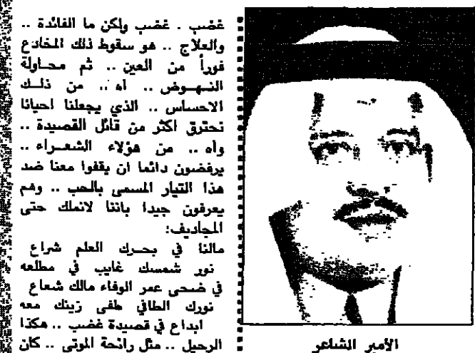
يوسف بن فهد بن سعد